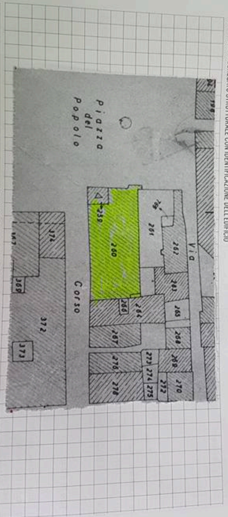
MAPPA DELL'AGGREGATO STRUTTURALE CON IDENTIFICAZIONE DELL'EDIFICIO